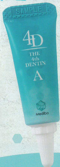
THE 4th DENTIN A A液 5mL