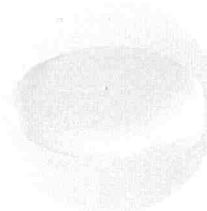
※内容物のイメージ画像