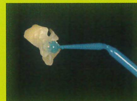
インレーの保持に