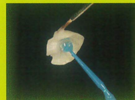
補綴物のステイニングに