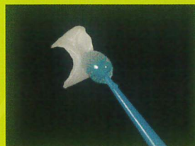
アンレーの保持に