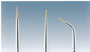
No.1 No.2 No.3