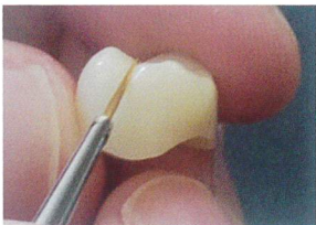
常温重合レジンの筆積や ステイニング用です。 (写真はNo.1使用)