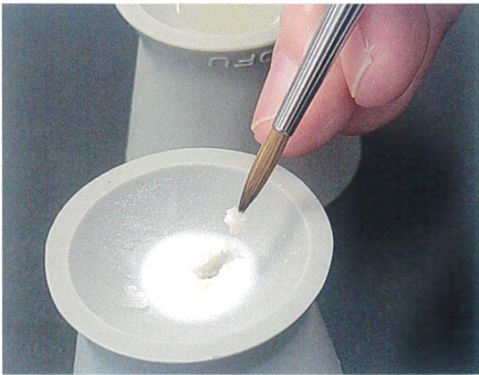
常温重合レジンの筆積用です。