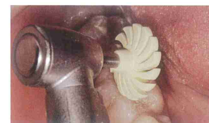
ライトグリーン(2-2)を用いてつや出し研磨