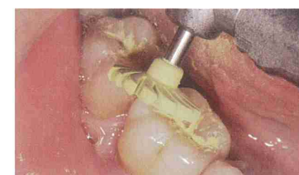
グリーン(2-1)を用いて仕上げ研磨