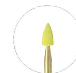
スモールポイント