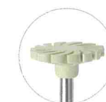
ホイール(ライトグリーン)