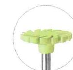
ホイール(グリーン)