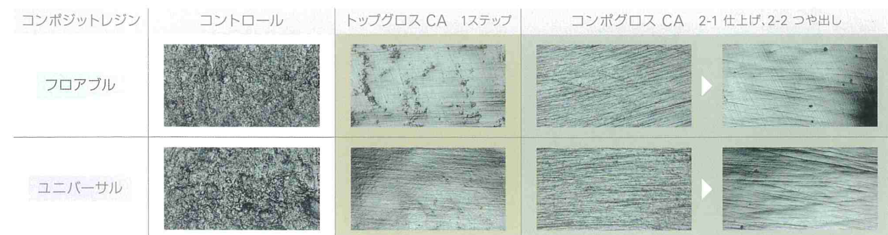
被研磨体表面 (200倍拡大)