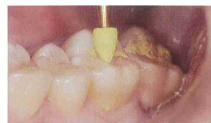
トップグロス CAを用いて表面研磨