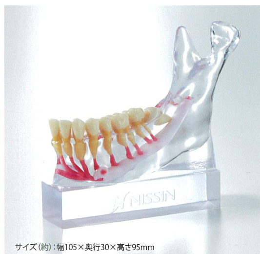
サイズ(約):幅105×奥行30×高さ95mm