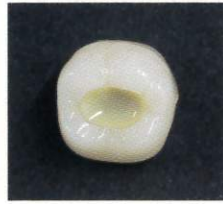
窩底部にトクヤマ マスキングオペレーターを塗布・硬化