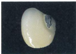
充填部の歯面清掃後