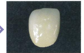
通常に従いコンポジットレジン を積層、光照射。硬化後仕上げ/研磨。