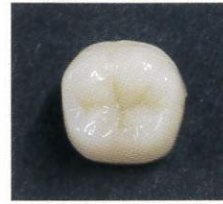
エステライトユニバーサルフロー A2で積層充填