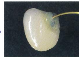
トクヤマ マスキングオペレーターを充填 ※1回の充填厚みは0.5mm以内とする