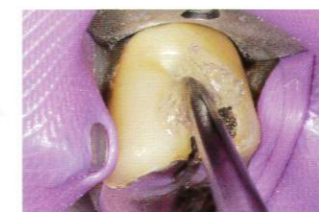
アルミナサンドブラスト処理後 「M&Cプライマー」にて前処理