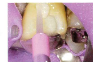
「ボンドフィルSBII(オページャス、マルチ)」を積層充填し、光照射