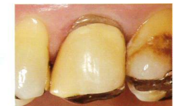
硬化後、形態修正・研磨