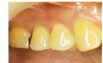
硬化後、形態修正・研磨