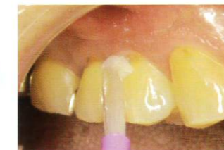
「ボンドフィルSBII(マルチ)」を充填