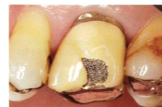
6| 硬質レジン前装部の破折

金属や陶材、硬質レジンが混在する前装部破折の修復には、高い接着性と適度な柔軟性がある「ボンドフィルSBII」が適しています。