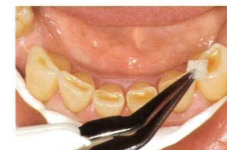
「ティースプライマー」にて前処理