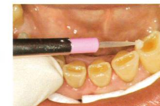
「ボンドフィルSBII(マルチ)」を充填