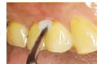
形成後、「ティースプライマー」にて前処理