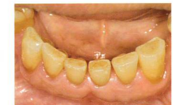
硬化後、咬合調整・研磨