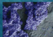
患者接触面から回収した DSBのSEM画像(倍率10,000倍)

参考: British Journal of Hospital Medicine 2022. K Ledwoch, K Vickery, J-Y Maillard