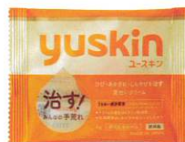
ユースキン 4g サンプル ストラップ付き