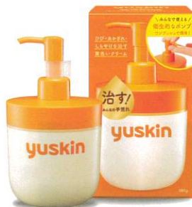
ユースキン 180g ポンプ