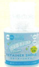
キャップ装着時本体