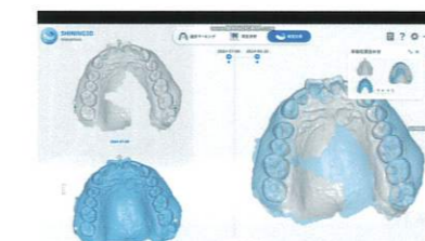
メトロントラック