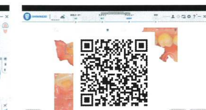
口腔内健康レポート