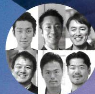
PrimeX Founders Japan