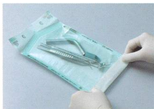
器材を滅菌バッグの中に入れ、封をします。