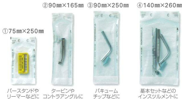
① 75mm×250mm バースタンドやリーマーなどに