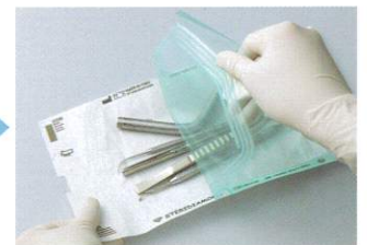
ご使用の際は、封入したときと反対側から開封して下さい。