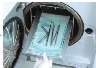
オートクレーブ滅菌または、エチレンオキサイドガス滅菌します。