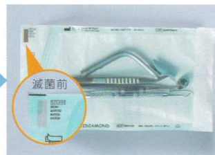
滅菌が完了するとインジケーターの色が変わります。