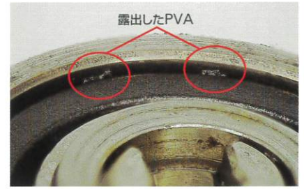
異物が固着した滅菌後のハンドピース

医療用包装資材分野のグローバルリーダーであるフランス ステリメッド社の医療用紙を使用しており、紙粉がほとんど出ません。