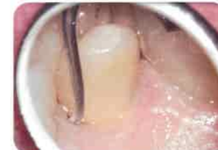
写真提供:萬田 久美子 歯科衛生士 (フリーランス)