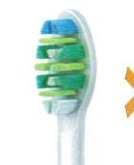
インターケアブラシ