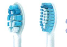
ガムプラスブラシ センシティブブラシ