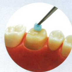
シーリング・コーティング

「BioコートCa®」及び「ハイブリッドコート™II」は、歯質表面を薄く硬い被膜でコーティングし、形成後の外来刺激や二次う蝕から歯質を守ります。 シーリング・コーティング以外にも知覚過敏抑制材、ボンディング材としてもご利用いただける、マルチユースな材料です。