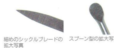
細めのシクルブレードの拡大写真 スプーン型の拡大写真

細めのブレード幅は隣接歯間部、スプーン型の作業部は舌側・口蓋側面などのスクレーリングに適しています。