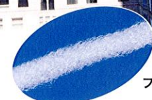
フィラメント拡大写真

歯ブラシでは除去できない 隣接面のプラークを除去します 通常のフロスの働きをします。