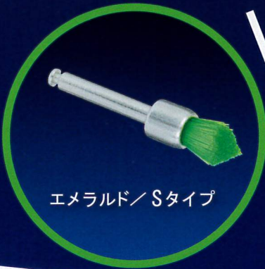
エメラルド/Sタイプ

4色の毛材から硬さを選んで 歯面清掃研磨もスムーズ！！ お口さわやかリフレッシュ