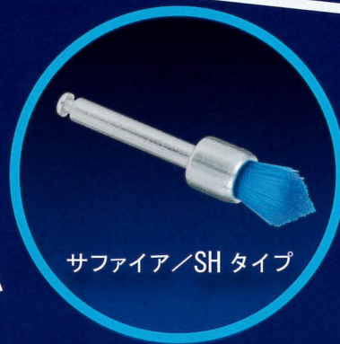
サファイア/SHタイプ