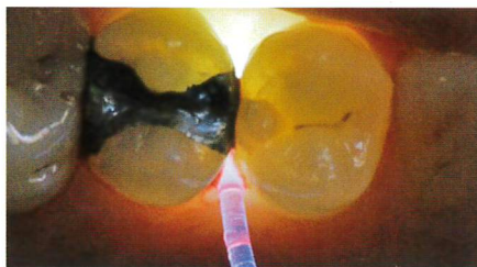
隣接面う蝕の観察

臼歯部カリエスはファイバーライトガイドを用いて観察することもできます。ファイバーを隣接歯間の辺縁線下に挿入し、咬合面側から観察。